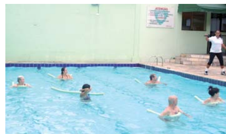
Hidroginástica: menos impacto