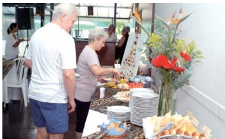
Cuidados com alimentação balanceada