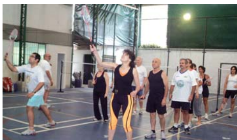
Badminton: esporte com orientação

Após o almoço, calculado pela nutricionista e produzido pela Rosely Buffet, hora de relaxar, com posturas de Yoga para melhorar a digestão, antes de iniciar outras atividades. Houve então circuito de ginástica, musculação e aula de hidroginástica. Ao final, Yoga, para relaxar, treinar atenção e concentração, ao som do Bolero de Ravel.