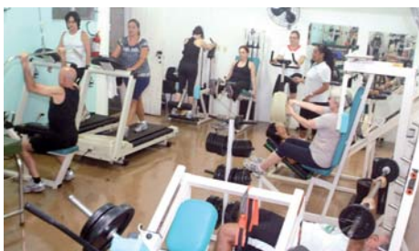
Musculação para fortalecimento