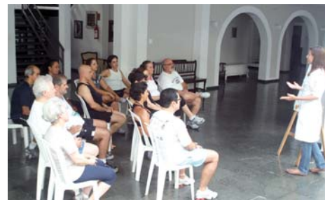
Nutricionista esclareceu dúvidas e mitos