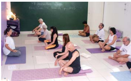
Yoga: alongamento, flexibilidade, força